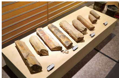
▲これが石棒！制作工程がわかる展示も