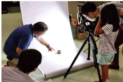
▲機材をセッティングし、本格的な撮影です