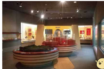
▲超レアな「飛騨みやがわ考古民俗館」

みなさんは「石棒」を知っていますか？それは、縄文時代に作られていた石でできた製品。祈りの道具では？と言われていますが、未だ謎の多い遺物です。その石棒が1074本も出土したのが、飛騨市の宮川町。