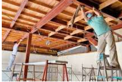
▲壊して、掃除して、作って…