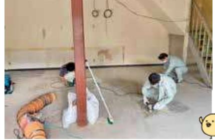
▲地道な作業も頑張っています！