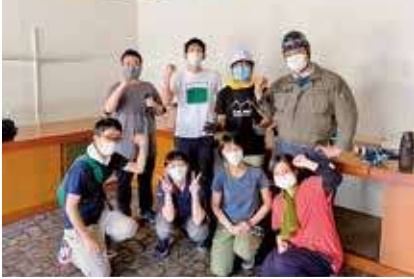
▲セルフビルド頑張っています！